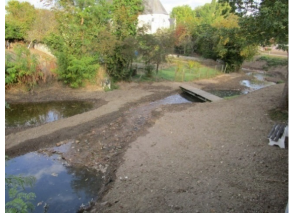
Photos avant/juste après du réaménagement du site