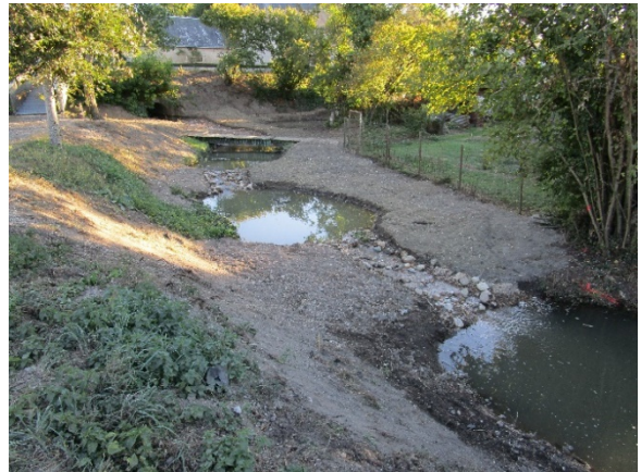
Photos avant/juste après du réaménagement du site