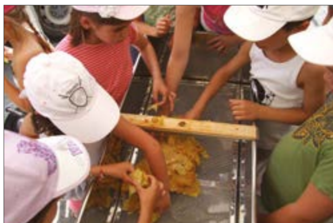
En 2013, la première récolte de miel a eu beaucoup de succès auprès des enfants des accueils de loisirs.

développement durable. Les Saintes-Mauriens désireux de s'investir dans le devenir de la commune constituent un fort potentiel. Pour cela, le comité de suivi citoyen va être relancé très