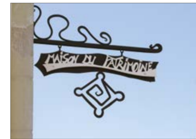
La Maison du patrimoine est située dans l'enceinte-même du château. Là où se trouvait, entre autres, l'office du tourisme.

Le programme complet des livrets seront disponibles en journées du patrimoine est d'ores et déjà consultable sur le site Internet de la ville. Des petits dans les tous prochains jours.