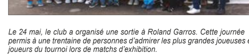
Le 24 mai, le club a organisé une sortie à Roland Garros. Cette journée a permis à une trentaine de personnes d'admirer les plus grandes joueuses et joueurs du tournoi lors de matchs d'exhibition.

Retrouvez toutes les infos sur notre site Internet : www.club2.fft.fr/tc-sainte-maure courriel : tc.sainte-maure@fft.fr