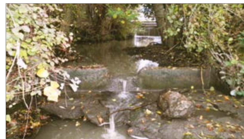
▲ Avant travaux ▼ Après travaux

Un autre projet qui concerne les Sainte-Mauriens est le contournement de la Manse au droit du plan d'eau communal au parc Robert Guignard. L'étude lancée il y a un an s'achève ce mois de septembre. Une première réunion de restitution en « comité de pilotage » (composé d'élus et de partenaires techniques et financiers) se déroulera fin septembre. Ensuite, les élus communaux décideront de concrétiser, ou pas, cette étude. Cette concrétisation signifie la réalisation de travaux.