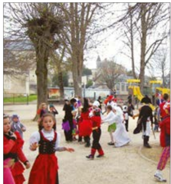
1 : Journée d'intégration en septembre (après-midi récréative au parc Robert Guignard pour intégrer les nouveaux élèves) / 2 : Cap sur la Bretagne pour les deux classes de CM en février / 3 : Carnaval, le 27 mars