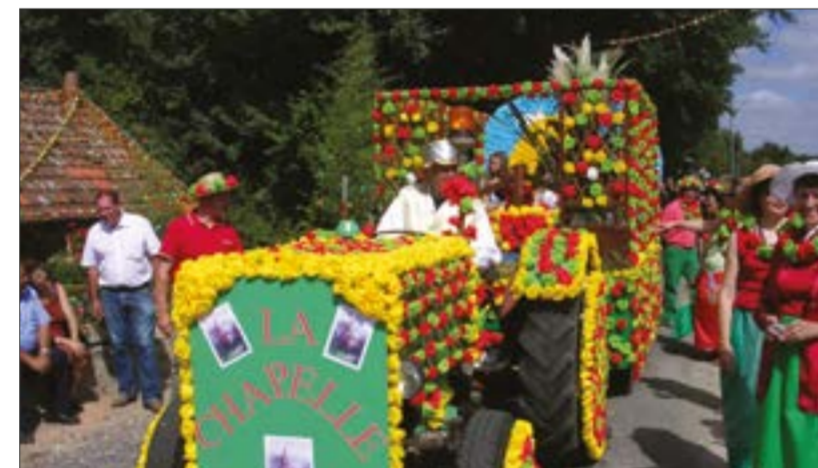
Le char du quartier de la Chapelle, en 2007

14h30 : départ du défilé de chars décorés - rue de la Robinerie