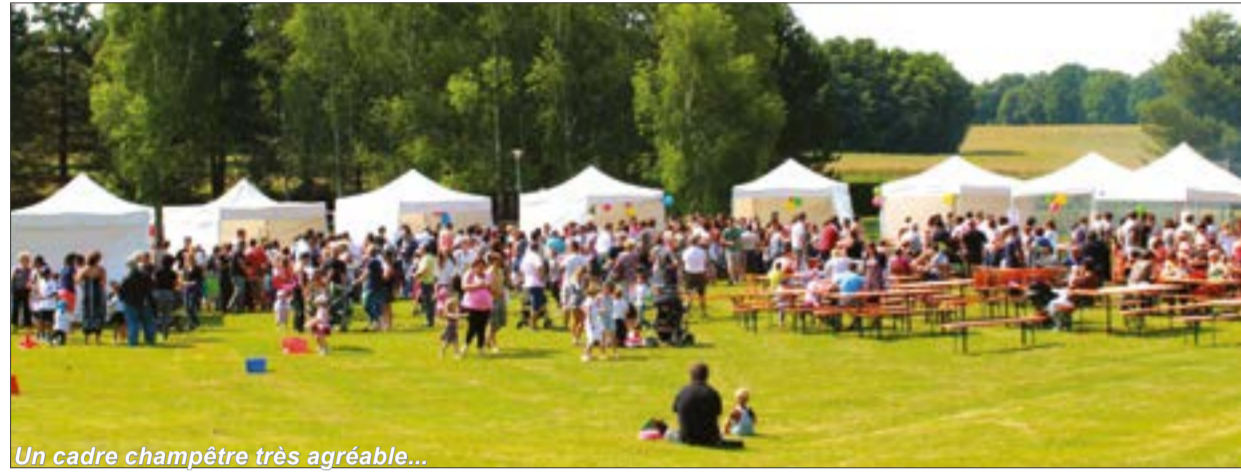
Un cadre champêtre très agréable...

Le 17 juin nous avons accueilli à l'école un animateur de la Galerie sonore d'Angers. Il a apporté, pour la plus grande joie des enfants, de nombreux et divers instruments de musique. Chaque élève a pu manipuler et jouer avec ses instruments du monde lors d'un atelier musical d'une heure. Cette animation a reçu un franc succès !