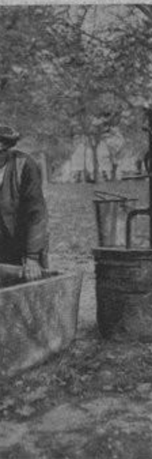
Le métayer parle à notre collaborateur. Lire l'article dans la troisième page