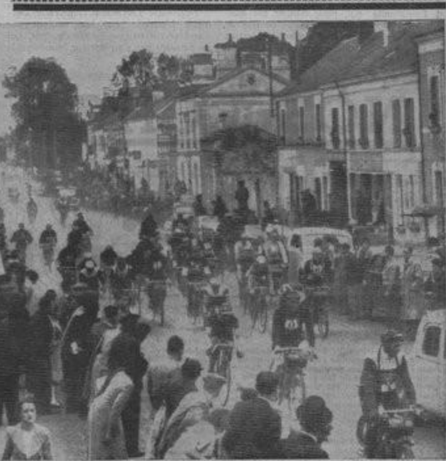
La prise des entraîneurs à Sainte-Maure.

Rossi, Egli et Laurent passaient en tête à Beaugency