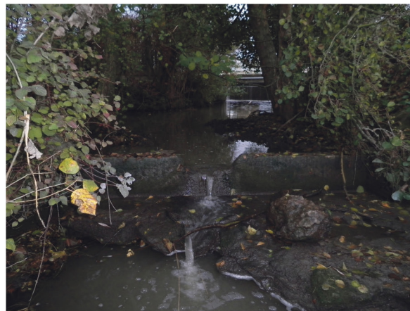
Avant travaux (2011)

Les travaux comprennent l'enlèvement de la vanne, échanture du radier, apport de pierres / cailloux et réduction de la section d'écoulement en période de basses eaux. Cela a eu pour effet d'éviter les bouchons (les branches ne se coincent plus dans l'ouvrage), d'assurer la remontée de la faune aquatique (il n'y a plus de chute) et de diminuer l'envasement du lit (les sédiments ne restent plus piégés derrière le seuil, et la section d'écoulement est pincée à l'étiage).