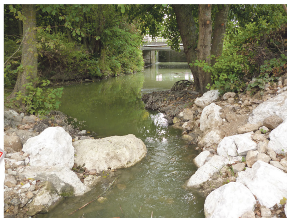
Après travaux (2012)