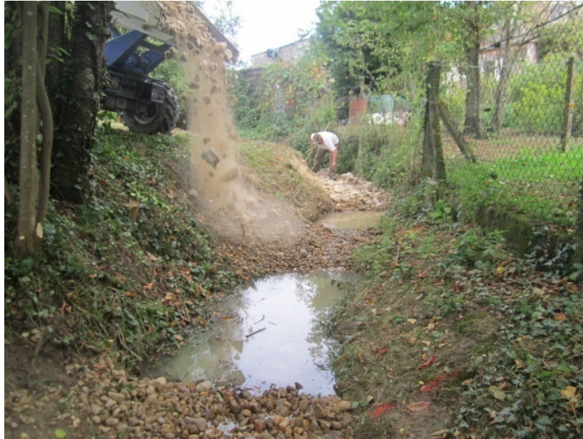
Photo de création de radiers alternés avec des petites fosses - travaux en cours (entreprise Joly de Rivière)