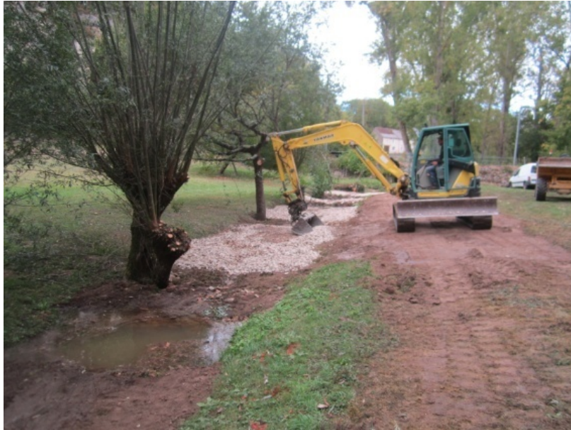
Photo d'apports de pierres dans le lit pour le rehausser (ennoisement seuil amont) travaux en cours (entreprise Anatole RABUSSEAU de Pouzay)