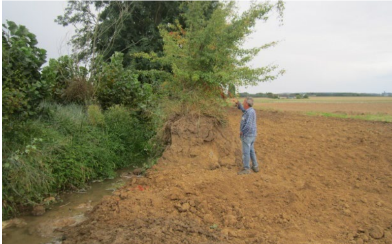
Photo de la hauteur de berge terrassée en pente douce (la motte de l'arbre donne une idée de la hauteur de berge avant travaux)