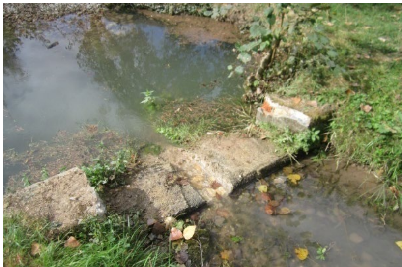
Photo d'un seuil échancré - travaux en cours (entreprise Anatole RABUSSEAU de Pouzay)