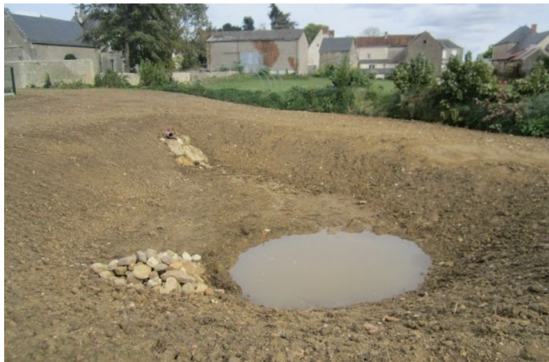
Photo d'une mare créée en vue de freiner et filtrer les eaux pluviales des ateliers municipaux (après première pluie)