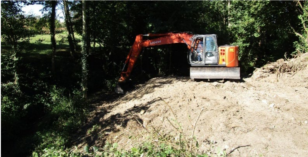
Photo du terrassement des berges en cours (entreprise Joly de Rivière)