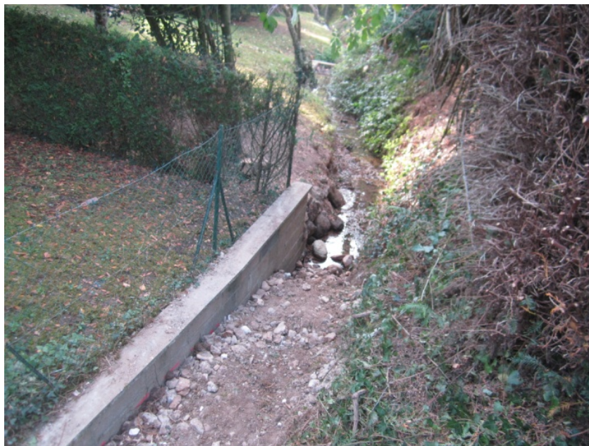
Photo de rehaussement du lit (ennoisement seuil en amont) - travaux en cours (entreprise Joly de Rivière)