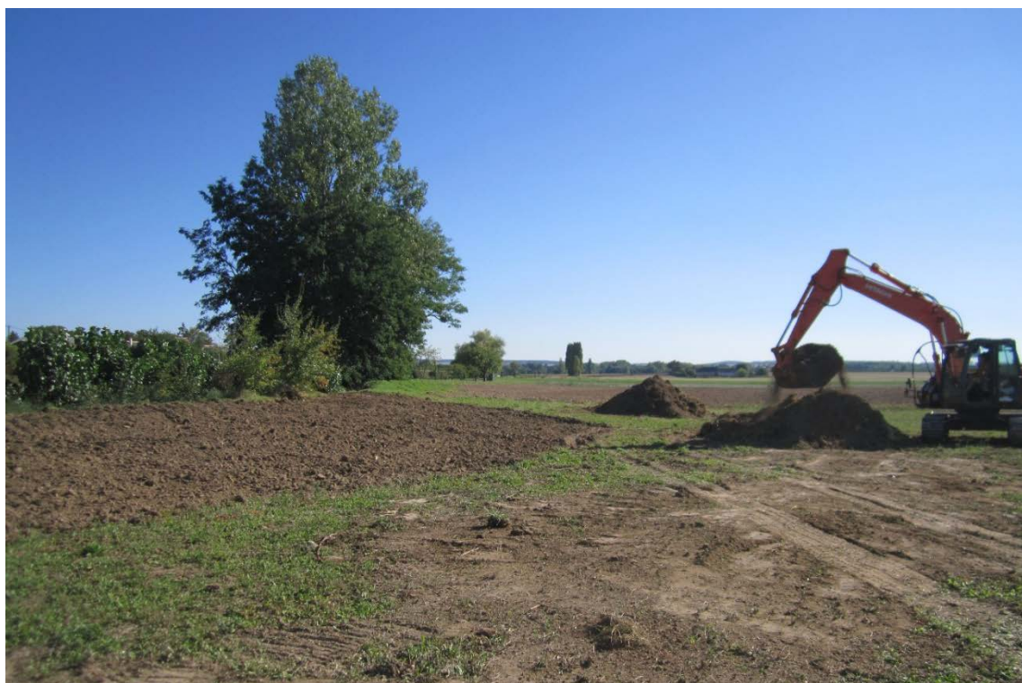
Les travaux débutent