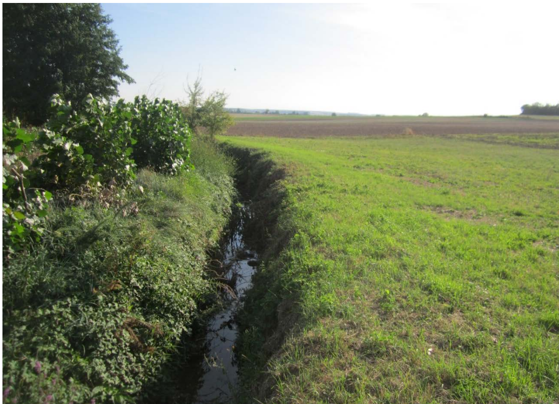
Vue sur la berge qui va être talutée en pente douce

Ces travaux sont financés par l'agence de l'eau Loire Bretagne dans le cadre d'une sélection d'un appel à projets « biodiversité » [CLIC]