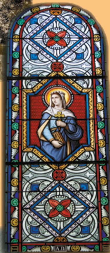
Vitrail de la Vierge Marie dans la chapelle - Virgin Mary stained glass - vidrieras de la Virgen María 2012