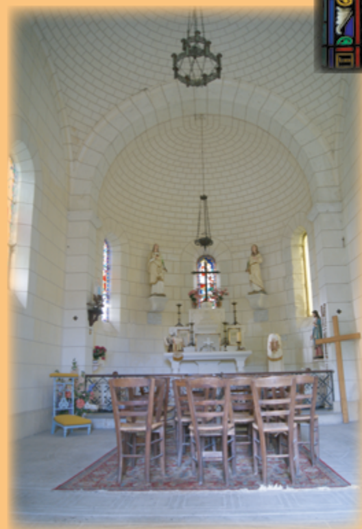
La nef et le chœur de la chapelle the nave and the chapel choir la nave y el coro de la capilla 2012