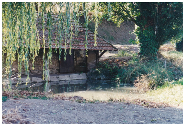
Le lavoir de Vaux en 1996

Le seigneur avait le droit "d'éteuf" sur les nouveaux mariés des "Quatre Grandes Portes" de Sainte-Maure. Ceux-ci, le jour de la Quasimodo, étaient tenus de chanter une chanson dans la "prée" (cette grande prairie située au bas des Vaux, entre la route de Saint Epain et la Manse), d'après CARRE DE BUSSEROLLE. Quant à lui, E.MONTROT indique que les femmes doivent chanter mais que les hommes doivent " 3 esteufs blancs de rente" au seigneur de Sainte-Maure. Certains auteurs assurent que ces esteufs devaient être joués et rattrapés par les jeunes hommes sous peine de devoir, de gré ou de force, franchir la Manse ! (l'esteuf était une petite balle de cuir - de chien, quelquefois ! - bourrée de son, servant notamment au jeu de paume)