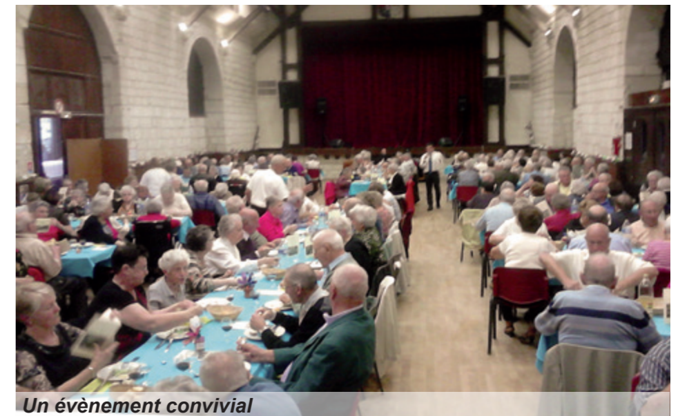
Un évènement convivial

L'accessibilité des logements est l'une des priorités de la loi handicap : en collaboration avec Val Touraine Habitat, la nouvelle équipe municipale a su répondre en un temps record à une situation inadmissible qui perdurait depuis plusieurs années concernant un habitant à mobilité réduite. En effet, en quatre mois, son logement situé rue Abbé Bourassé a été réhabilité dans sa globalité pour qu'il puisse vivre