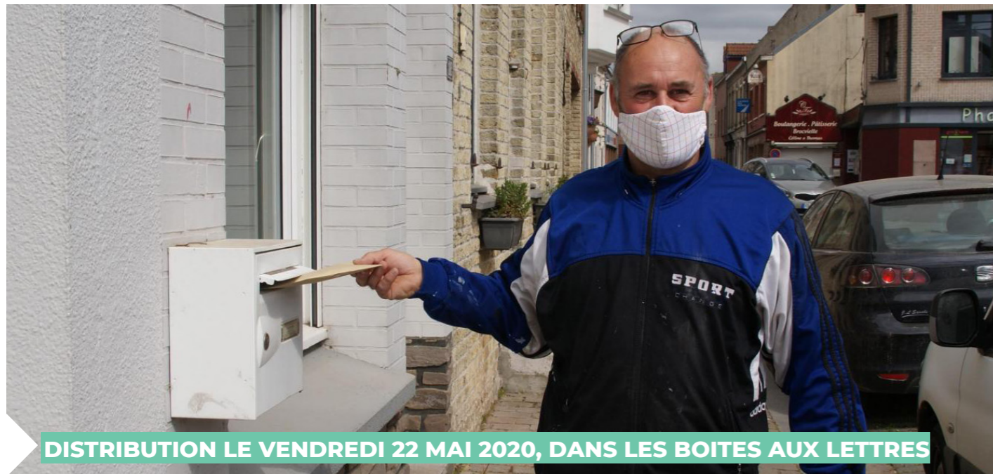
DISTRIBUTION LE VENDREDI 22 MAI 2020, DANS LES BOITES AUX LETTRES

Les personnes âgées étant considérées comme à risque, nous souhaitons les équiper en priorité. Pour cela, les agents municipaux et les élus procéderont à une distribution dans les boîtes aux lettres des personnes de 60 ans et plus, sur la base du recensement établi par le Centre Communal d'Action Sociale, le tout en respectant les gestes barrières.