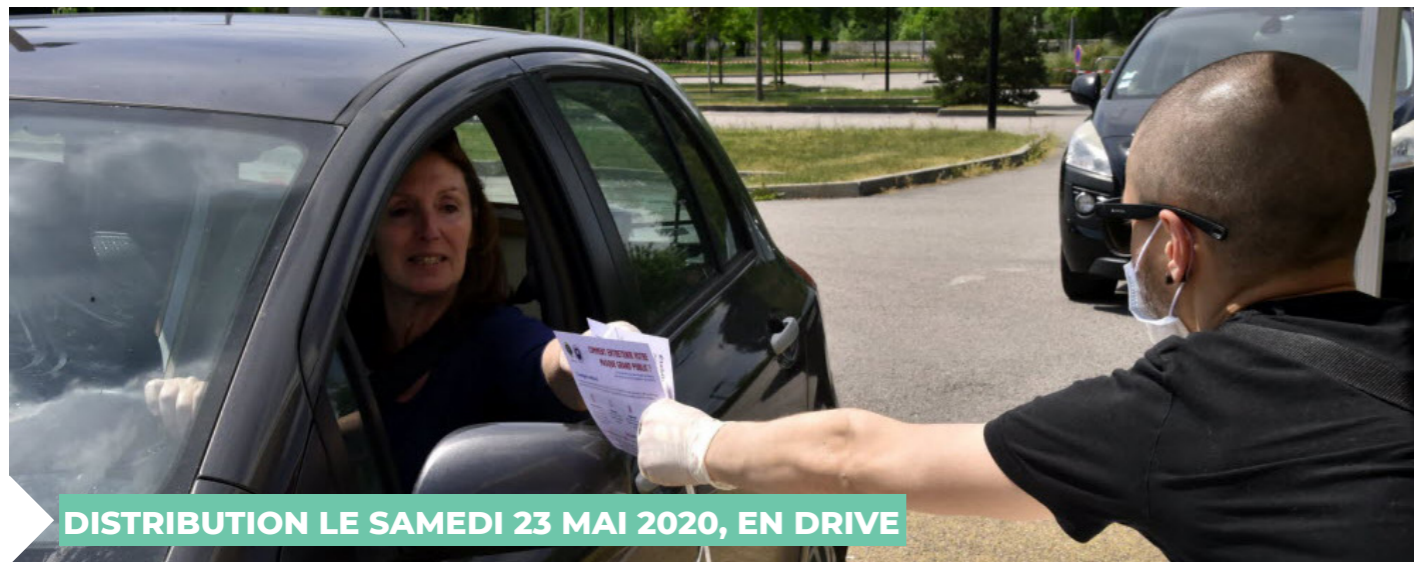
DISTRIBUTION LE SAMEDI 23 MAI 2020, EN DRIVE

La distribution de ces équipements se fera le samedi 23 mai, de 9h à 12h et de 14h à 17h, lors d'une permanence dans les différents quartiers de la ville. Cette distribution se fera par retrait en drive sur présentation d'un justificatif de domicile et du livret de famille.